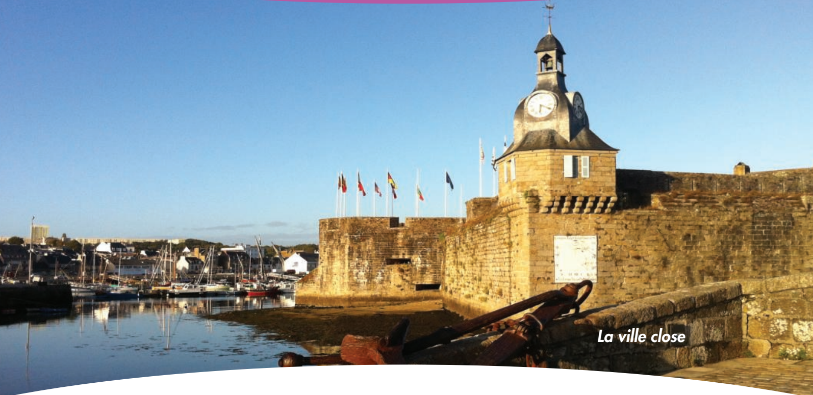
La ville close

Concarneau et ses remparts, appelée aussi la ville-close, est l'un des sites les plus visités de Bretagne.