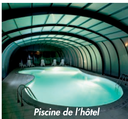
Piscine de l'hôtel