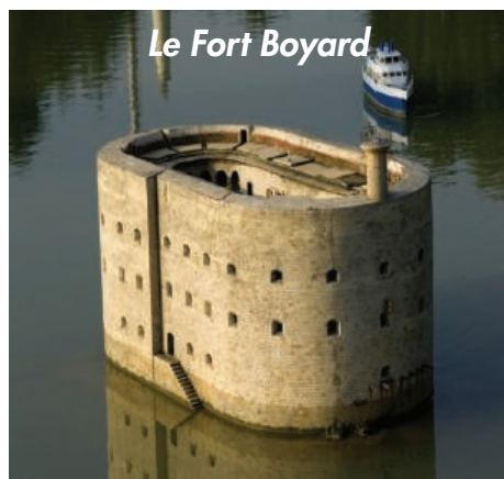
Le Fort Boyard