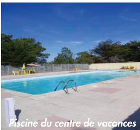
Piscine du centre de vacances

La structure se situe au cœur de la pinède. Piscine et mini-golf sur place, nombreux terrains de sports. Lits superposés